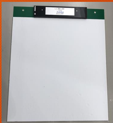
Motion Gravity 本体 センサー部分 48cm X 48cm